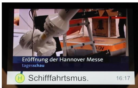
Bild: Information an der Haltestelle mit k.now