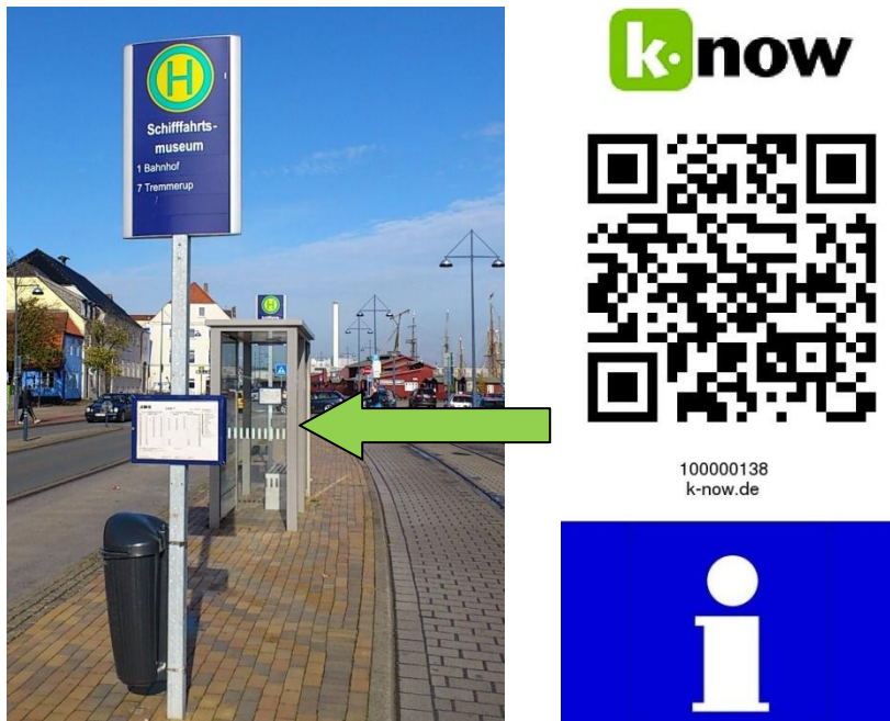
Bild: Wartehalle Haltestelle Schifffahrtsmuseum mit k.now-QR-Code

In einer ersten Testphase sollen 6 Haltestellen mit k.now ausgestattet werden. Nach Beendigung der Tests ist dann geplant, in einem weiteren Schritt bis zu 40 ausgewählte Haltestellen mit k.now bzw. dessen QR-Codes auszustatten. Danach soll der Ausbau schrittweise erweitert werden.